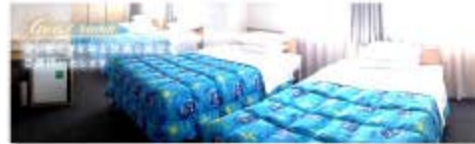
しなやかで安定感のある寝心地のポケットコイルマットレス