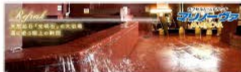
疲労回復等の効能に優れた「準天然光石温泉」を用いた大浴場